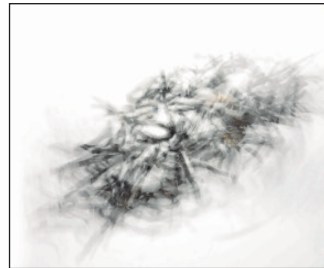
“Paisajes inducidos” seriekoa De la serie “Paisajes inducidos”

En otra dimensión, Westbourne bridge, Algunos sobre blanco, Muchos sobre blanco, Paisajes inducidos y Begiradak, son