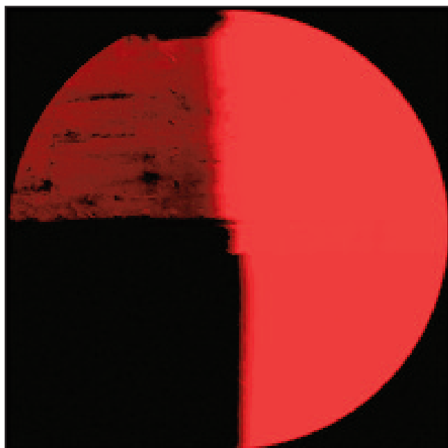
“Westbourne bridge” seriekoa De la serie “Westbourne bridge”