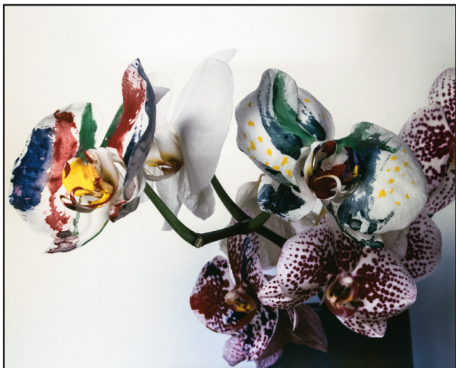
Nobuyoshi ARAKI Untitled from painted flowers, 2008