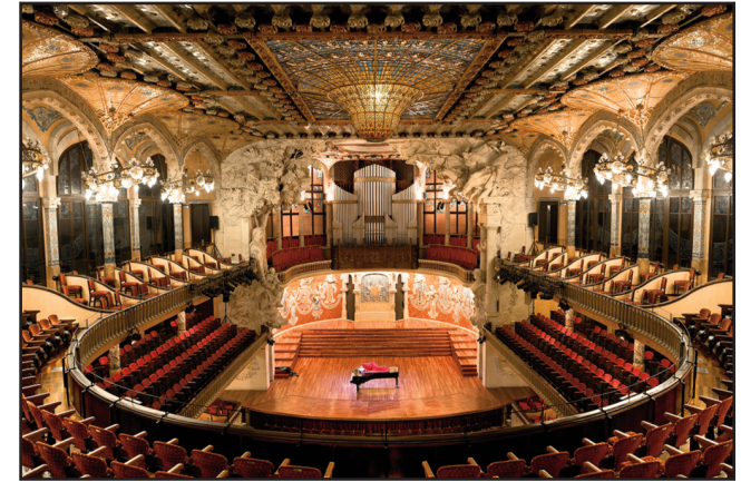
Eugenio AMPUDIA Dónde dormir 5 (Palau), 2005