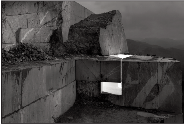
Aitor ORTIZ Muros de Luz 021, 2005