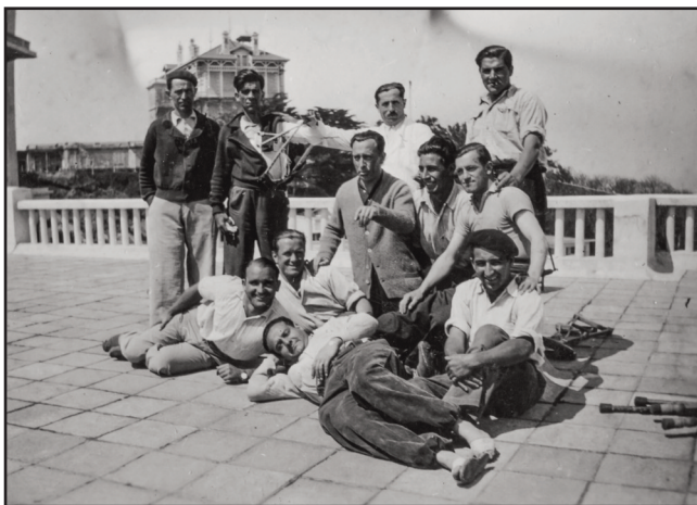
La Roseraieko egoiliar zaurituak eta medikua ospitaleko terrazan. Residentes heridos de La Roseraie y personal médico en la terraza del hospital.