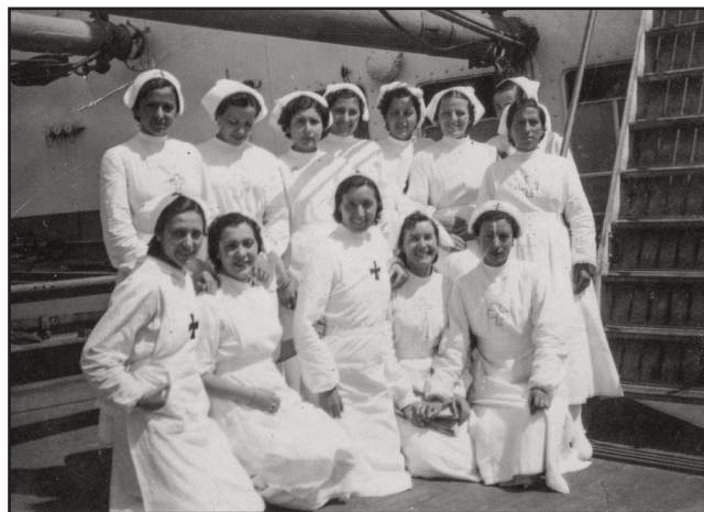
Habana itsasontzi-ospitaleko erizainen taldea Bordelen. Grupo de enfermeras del barco hospital Habana en Burdeos.