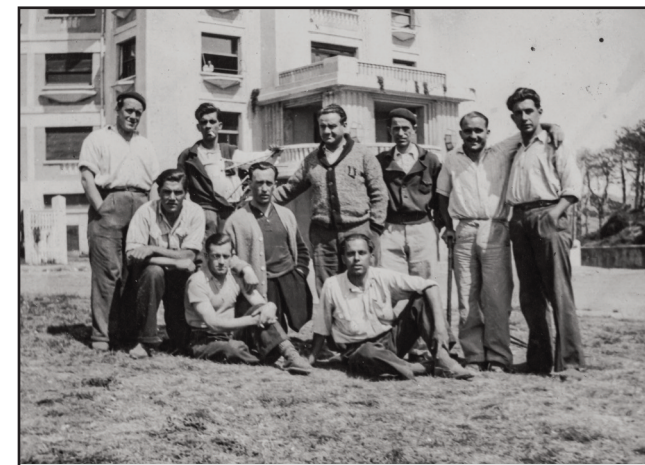
La Roseraieko pazienteak ospitalearen inguruan. Pacientes de La Roseraie en las inmediaciones del hospital.