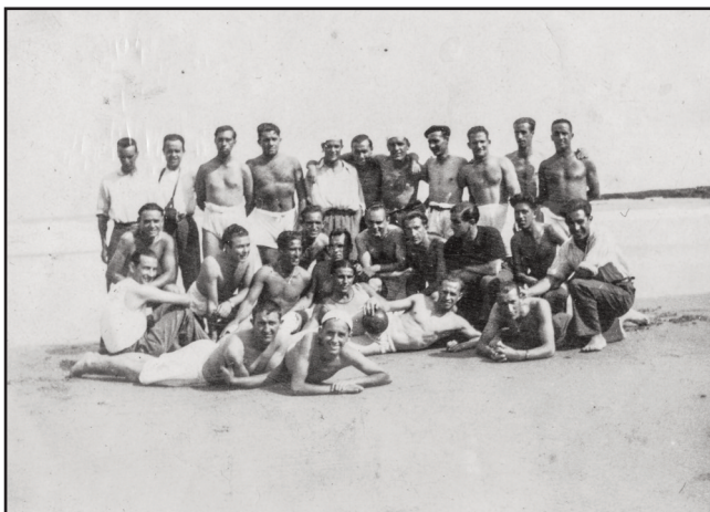
La Roseraieko pazienteak Biarritzeko hondartzetako batean. Pacientes de La Roseraie en una de las playas de Biarritz.