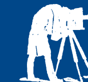
1993tik Argazkigintzaren alde

Photomuseum Argazki & Zinema Museoa Zarautz